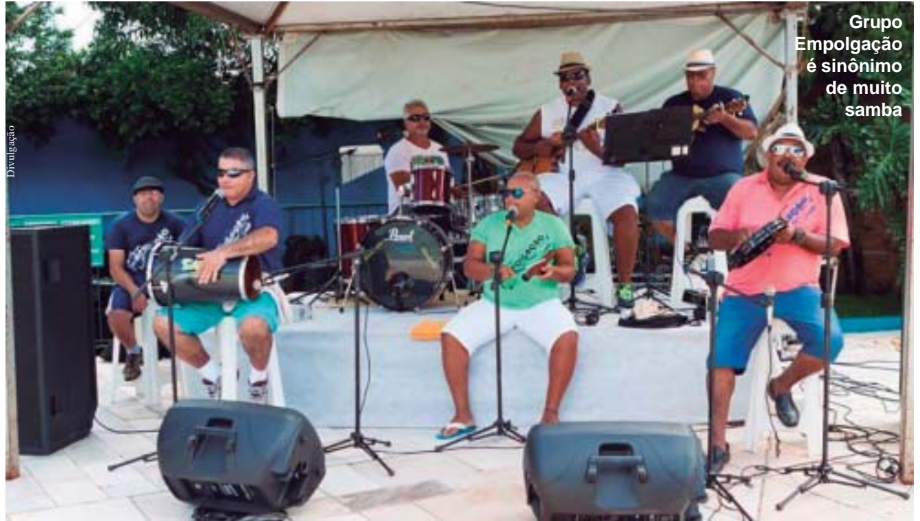
Grupo Empolgação é sinônimo de muito samba

gratuita. A entrada será pelo Salão Social. Mais informações pelo telefone 3872-1917.