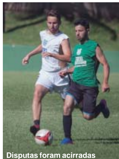
Disputas foram acirradas