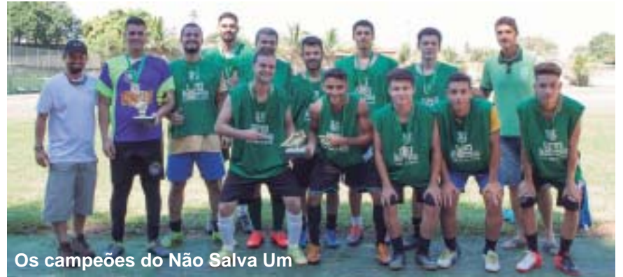
Os campeões do Não Salva Um