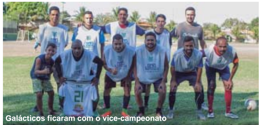
Galácticos ficaram com o vice-campeonato