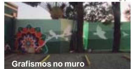
Grafismos no muro