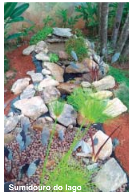
Sumidouro do lago