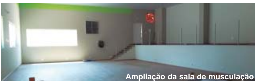
Ampliação da sala de musculação