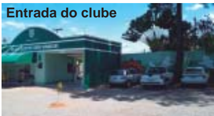
Entrada do clube