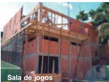
Sala de jogos