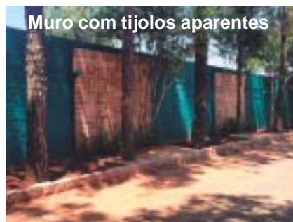
Muro com tijolos aparentes