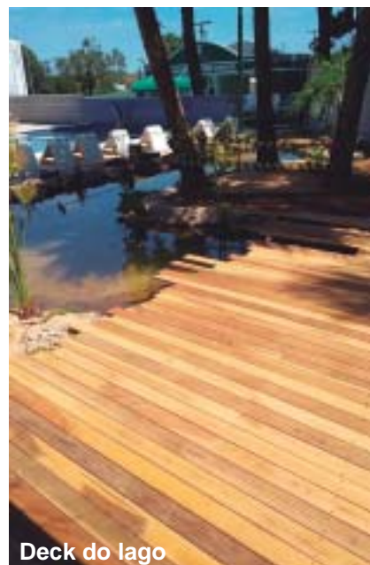
Deck do lago