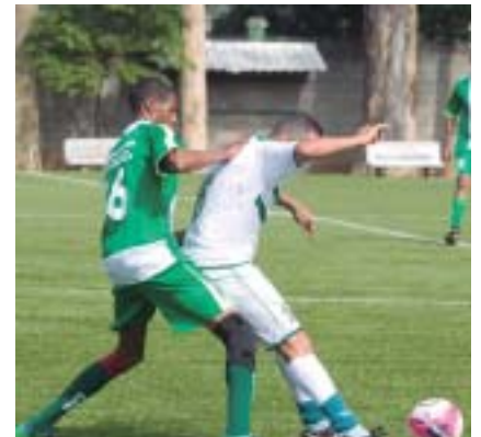
Veja todas as fotos no site e no facebook