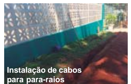
Instalação de cabos para para-raios