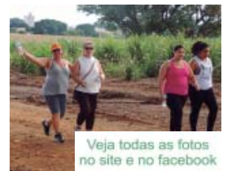
Veja todas as fotos no site e no facebook