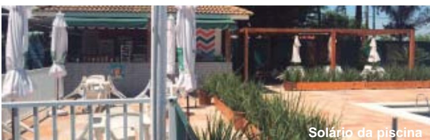
Solário da piscina