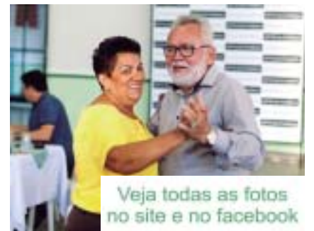
Veja todas as fotos no site e no facebook