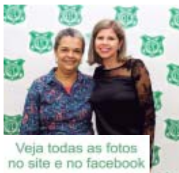
Veja todas as fotos no site e no facebook