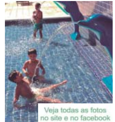
Veja todas as fotos no site e no facebook