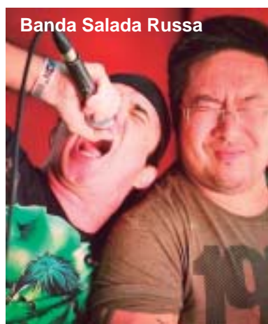
Banda Salada Russa

Para entrar na balada, é obrigatório estar fantasiado. A entrada é liberada para maiores de 16 anos. Quem tem 14 e 15 anos precisa estar acompanhado de um responsável. A festa tem entrada gratuita para associados do Cosmopolitano. Não sócios podem adquirir convites na secretaria do clube, Jamar Calçados e Óticas Ipanema.