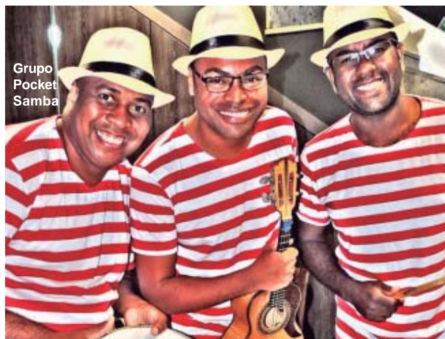
Grupo Pocket Samba

com linguiça calabresa e paio ou com costelinha e lombo de porco. Como acompanhamentos, arroz branco, couve, farofa, laranja e molho de pimenta caseiro. Para entrada, será montada uma Ilha de Saladas com as opções Fresh (alface americana e roxa, morangos, manga, queijo minas frescal e molho de alecrim) e Caipira (alface crespa, pepino, cenoura, beterraba e tomate). Para sobremesa, haverá mousse de limão e de maracujá. As adesões custam R$ 45,00 para adultos e R$ 20,00 para crianças de 7 a 12 anos. Bebidas serão cobradas à parte.