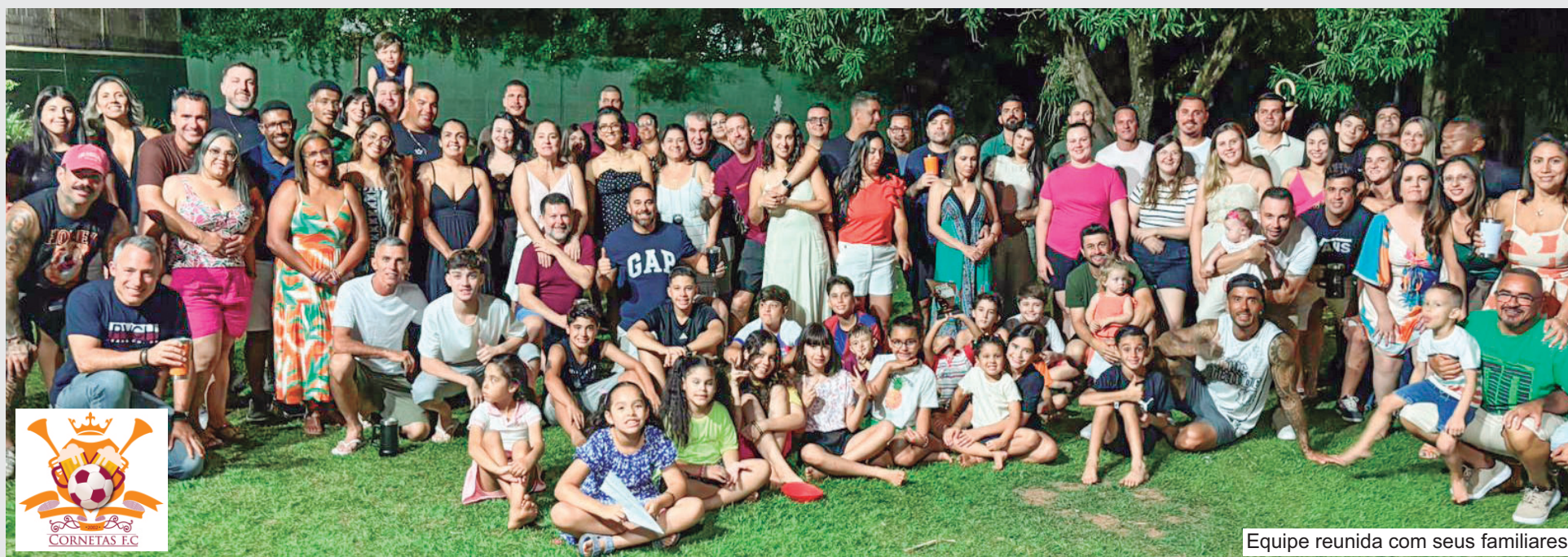
Equipe reunida com seus familiares

Entre as curiosidades que evidenciam o nível de organização do grupo estão o registro oficial de estatísticas de presença, vitórias, derrotas e até de quem apitou os jogos, regras específicas até para o tradicional grito de “olé” e uma coordenação eleita anualmente por voto secreto. Assim, o Cornetas FC segue sua trajetória unindo futebol, amizade e solidariedade, mostrando que vestir essa camisa é também assumir um compromisso coletivo e social.