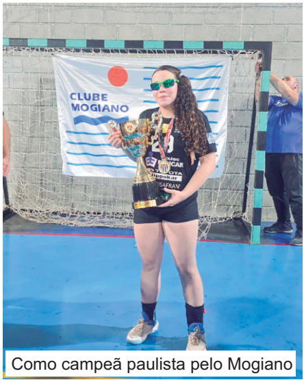
Como campeã paulista pelo Mogiano