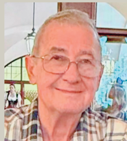
Por Valber Kowalesky

A todos esses abnegados e apaixonados pelo Cosmopolitano FC, deixo aqui nosso respeito, admiração e gratidão. Viva o Cosmopolitano FC!