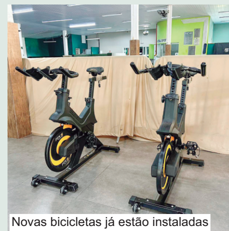
Novas bicicletas já estão instaladas

Com mais comodidade e estrutura, o Cosmopolitano reafirma seu compromisso em oferecer experiências cada vez melhores aos associados.