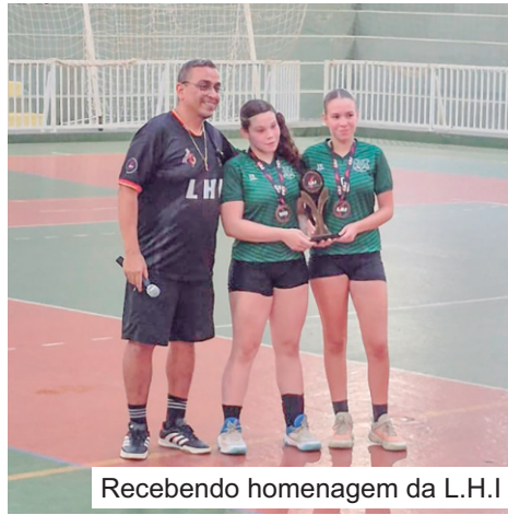
Recebendo homenagem da L.H.I