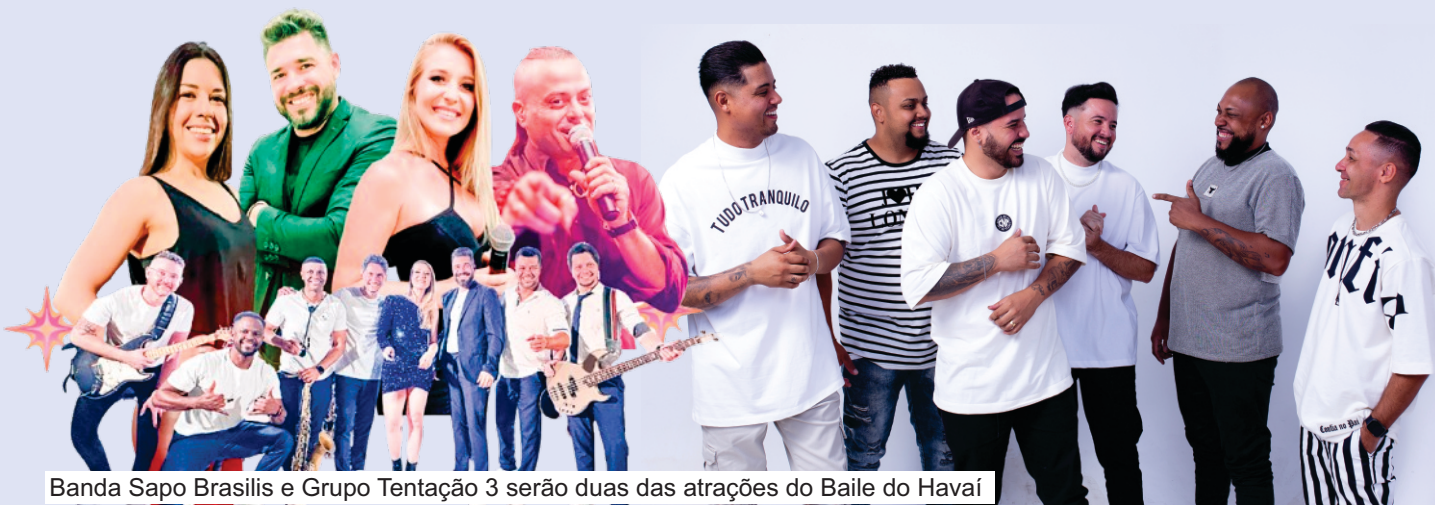
Banda Sapo Brasilis e Grupo Tentaçãoz 3 serão duas das atrações do Baile do Havaí