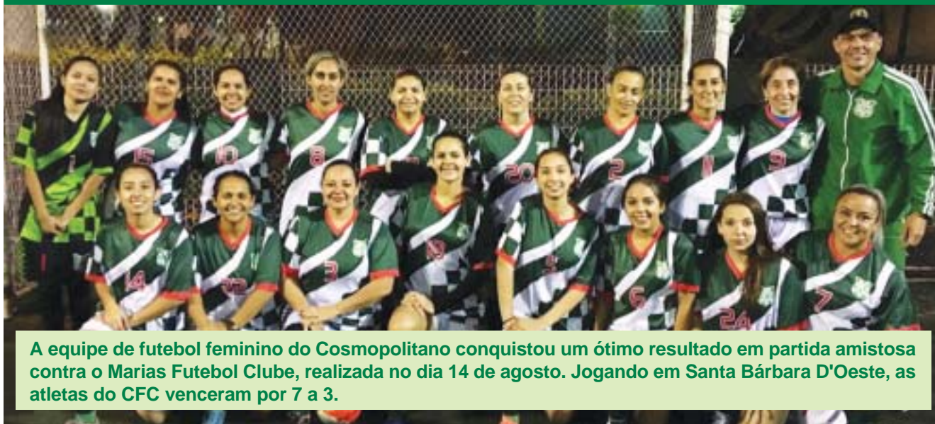
A equipe de futebol feminino do Cosmopolitano conquistou um ótimo resultado em partida amistosa contra o Marias Futebol Clube, realizada no dia 14 de agosto. Jogando em Santa Bárbara D'Oeste, as atletas do CFC venceram por 7 a 3.