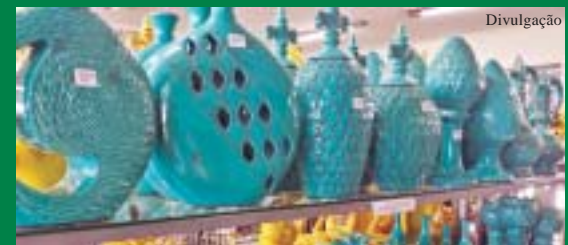
Loja de cerâmica em Pedreira

Os associados do Cosmopolitano poderão usufruir de um excelente desconto para participar de um passeio a Pedreira, que será realizado no dia 5 de outubro. Para os sócios, o valor da viagem será de R$ 25,00. Para não sócios, de R$ 45,00. A saída está marcada para as 7h30. A volta acontecerá às 16h30. Haverá almoço no restaurante Peixada do Lago, não incluso no valor. Os interessados devem realizar a reserva na secretaria do clube, mediante pagamento.