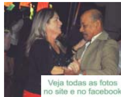
Veja todas as fotos no site e no facebook