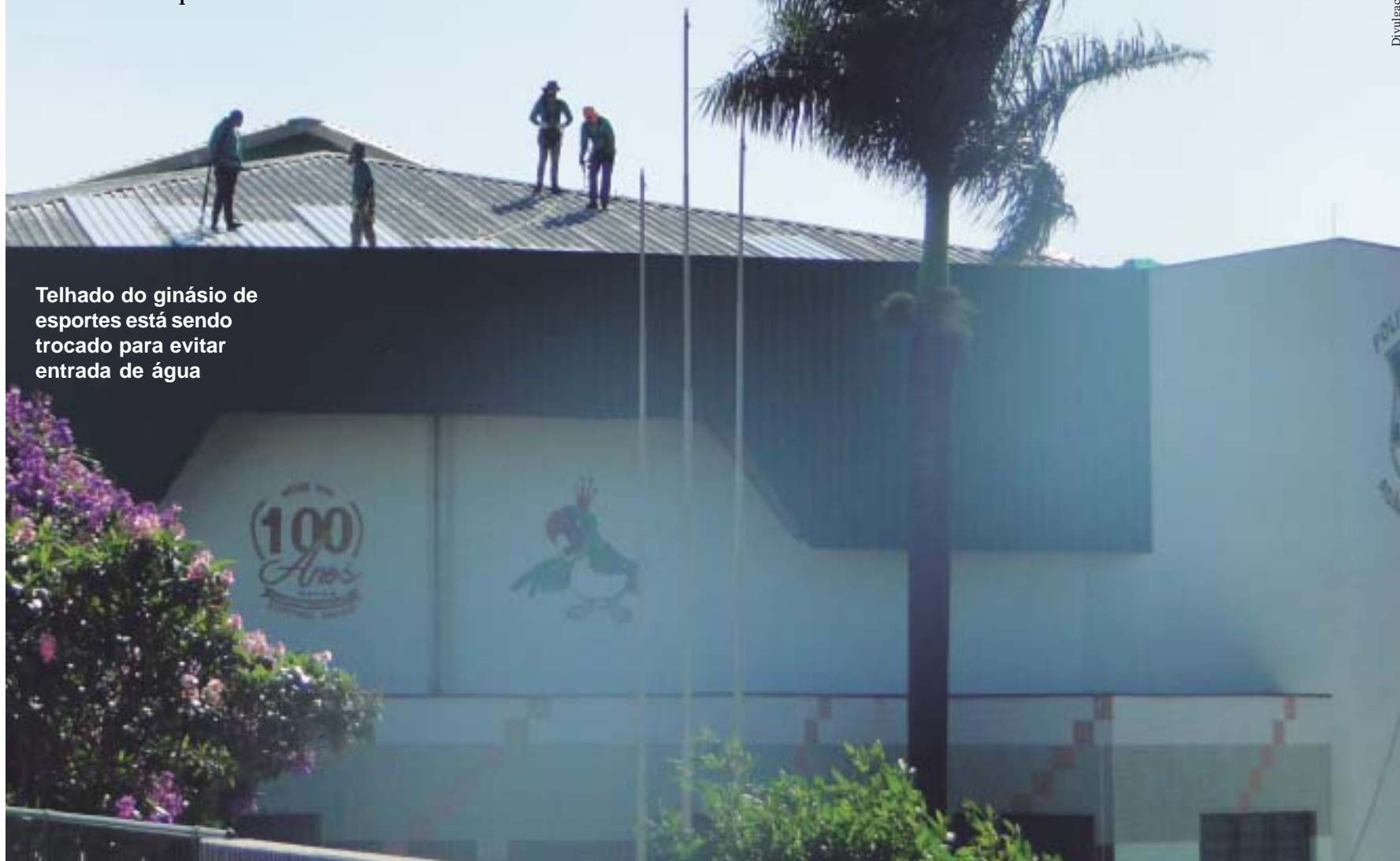
Telhado do ginásio de esportes está sendo trocado para evitar entrada de água

ganharão espaços-família, onde as mães e seus filhos e os pais e suas filhas poderão ter toda a privacidade. Ambos também vão passar a contar com banheiros acessíveis, para deficientes. E o vestiário feminino ainda passará a oferecer mais três chuveiros, atendendo, assim, à grande demanda do local.