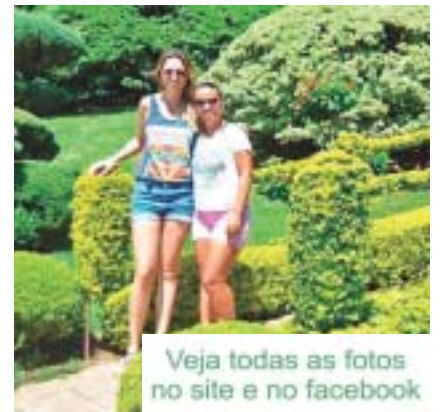
Veja todas as fotos no site e no facebook