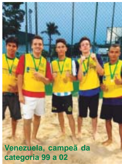
Venezuela, campeã da categoria 99 a 02