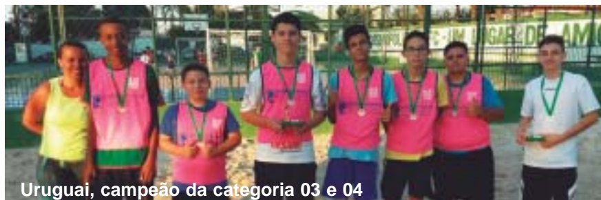
Uruguai, campeão da categoria 03 e 04