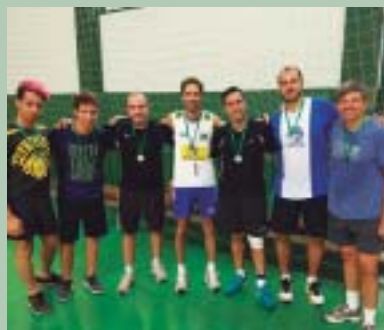
Cruzeiro, o vice-campeão