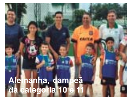
Alemanha, campeã da categoria 10 e 11