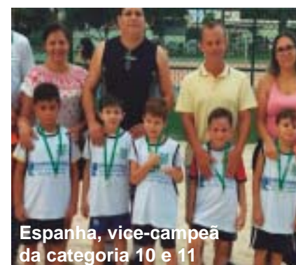
Espanha, vice-campeã da categoria 10 e 11