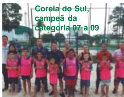
Coreia do Sul, campeã da categoria 07 a 09