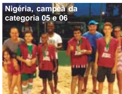
Nigéria, campeã da categoria 05 e 06