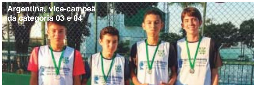
Argentina, vice-campeã da categoria 03 e 04