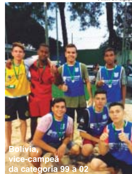
Bolívia, vice-campeã da categoria 99 a 02