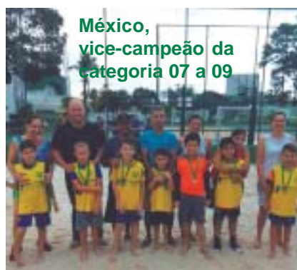
México, vice-campeão da categoria 07 a 09

Veja todas as fotos no site e no facebook