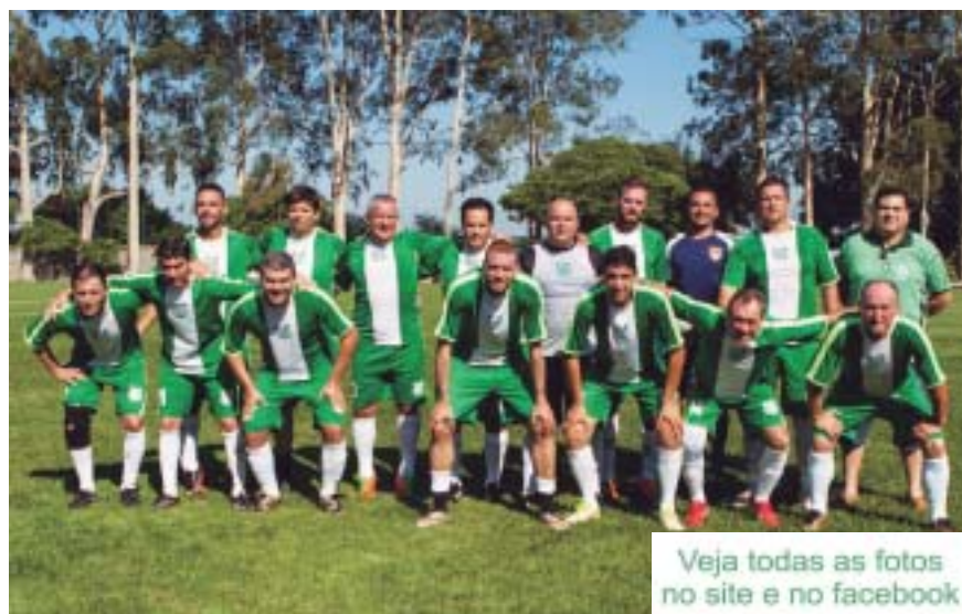
Veja todas as fotos no site e no facebook