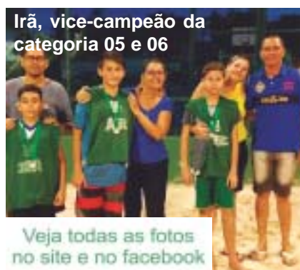
Irã, vice-campeão da categoria 05 e 06

Veja todas as fotos no site e no facebook