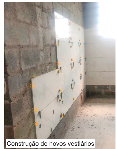
Construção de novos vestiários