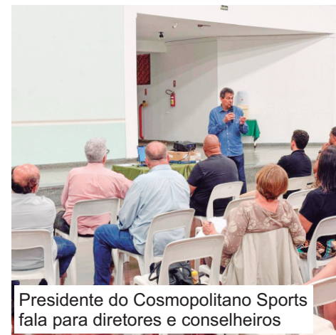
Presidente do Cosmopolitano Sports fala para diretores e conselheiros