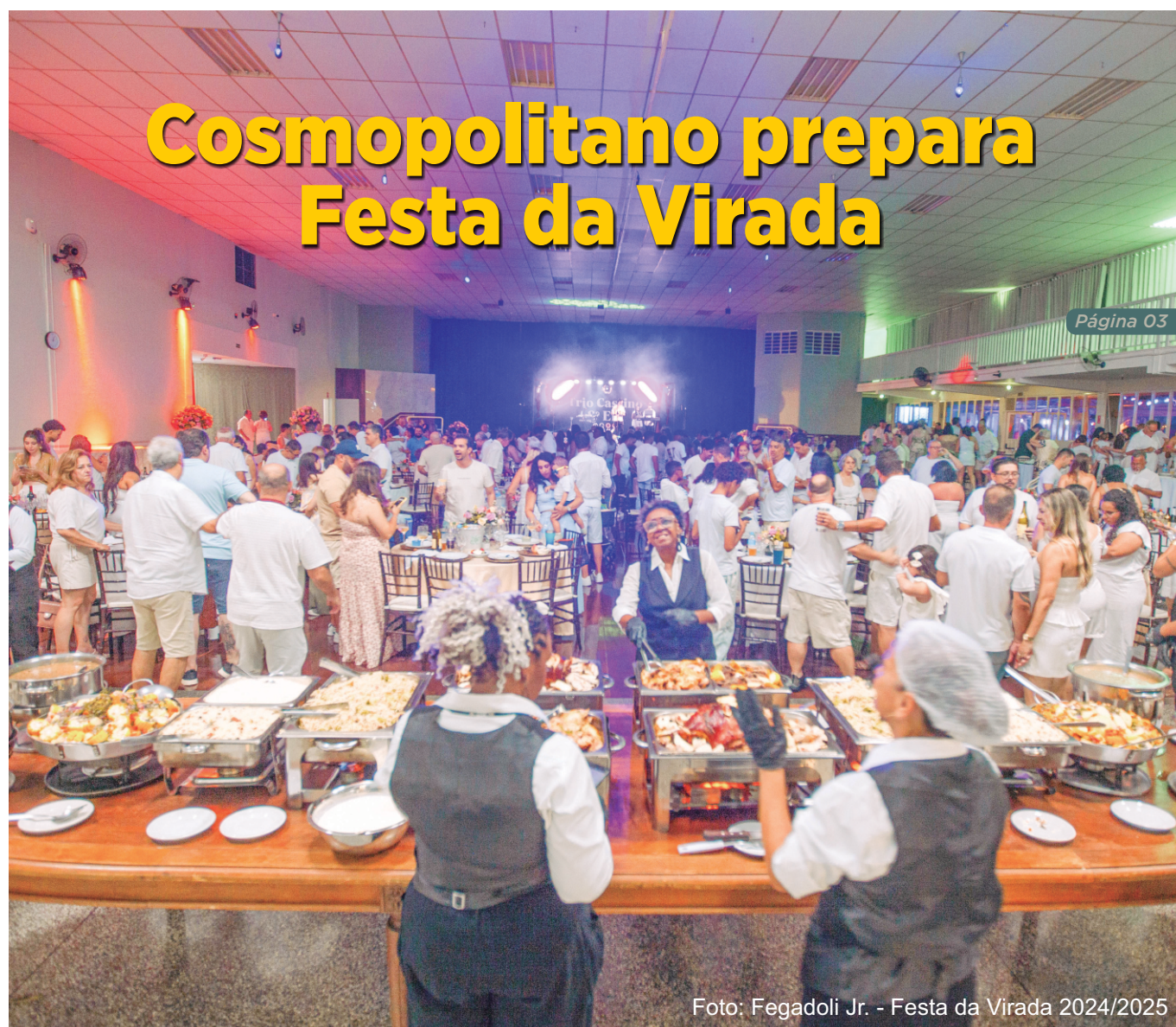
Festa da Virada 2024/2025

Veja as fotos das comemorações de aniversário que marcaram o mês de novembro