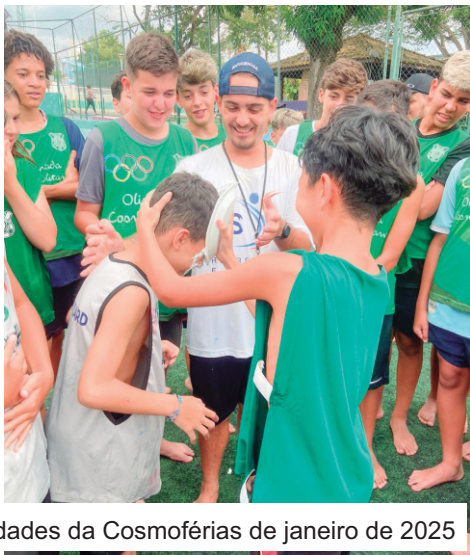
Atividades da Cosmoférias de janeiro de 2025