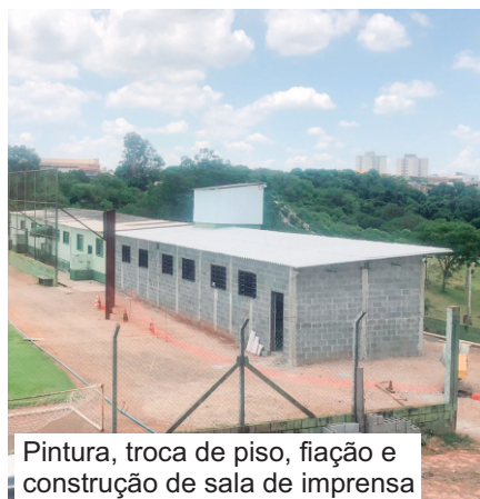
Pintura, troca de piso, fiação e construção de sala de imprensa