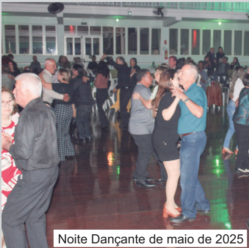
Noite Dançante de maio de 2025