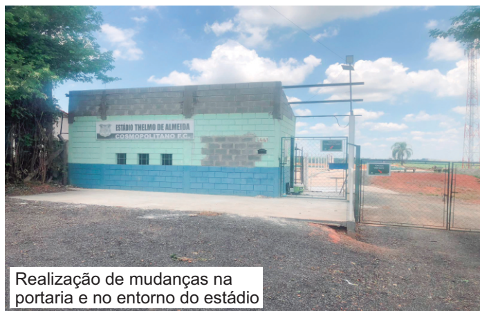
Realização de mudanças na portaria e no entorno do estádio