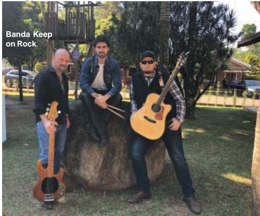
Banda Keep on Rock