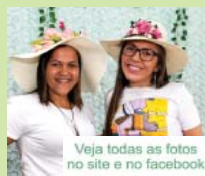
Veja todas as fotos no site e no facebook