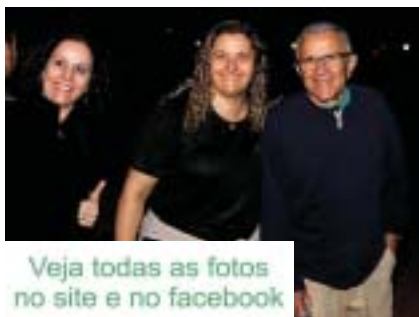
Veja todas as fotos no site e no facebook

www.diskentulhocolibri.com.br Entregamos caçamba em: Residências, Chácaras, Condomínios e Indústrias F: (19)3872-2710 / 3872-3200 ID 84*242466 / 7812-1750 Avenida da Saudade, 2309 - Colibri