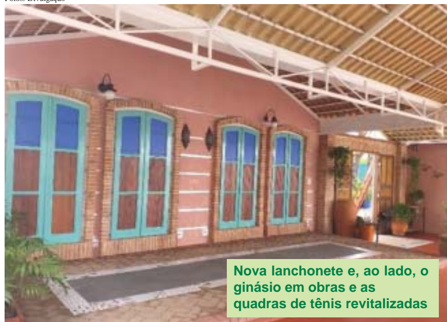
Nova lanchonete e, ao lado, o ginásio em obras e as quadras de tênis revitalizadas