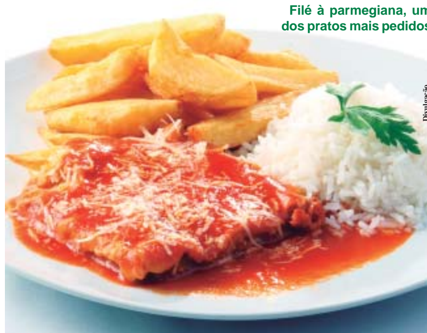
Filé à parmegiana, um dos pratos mais pedidos

Esse molho também dá ainda mais sabor a outro prato muito pedido, o filé à parmegiana. Se a opção é por um peixe, uma boa dica é a tilá-