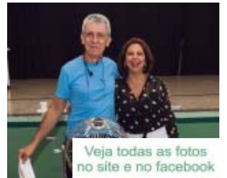
Veja todas as fotos no site e no facebook