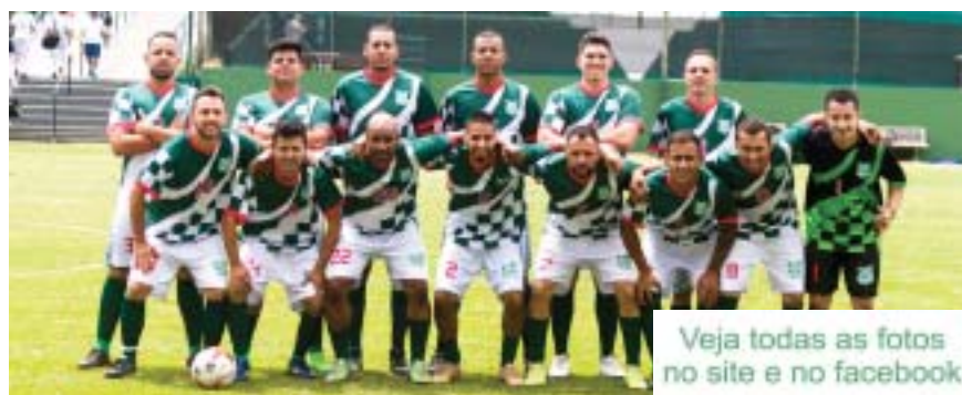
Veja todas as fotos no site e no facebook