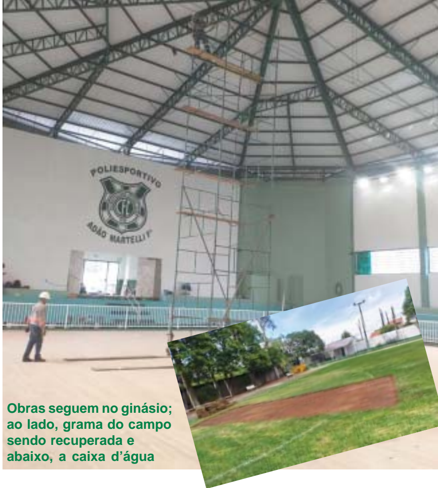
Obras seguem no ginásio; ao lado, grama do campo sendo recuperada e abaixo, a caixa d'água

As melhorias nas dependências do Cosmopolitano seguem aceleradas, abrangendo diversas áreas. Entre elas, está a total revitalização do Ginásio de Esportes. A etapa inicial, focada na parte interna, está em fase de conclusão.