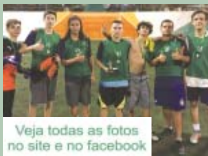
Veja todas as fotos no site e no facebook