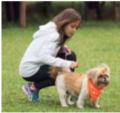
Veja todas as fotos no site e no facebook