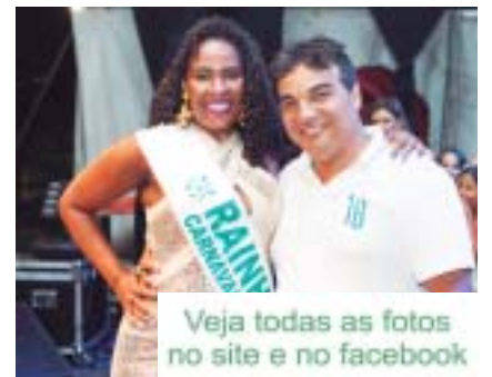
Veja todas as fotos no site e no facebook