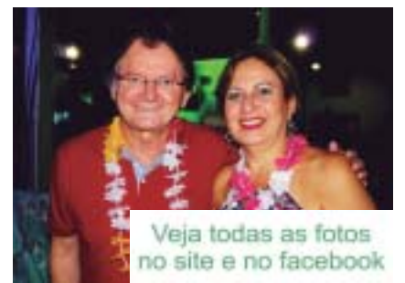
Veja todas as fotos no site e no facebook