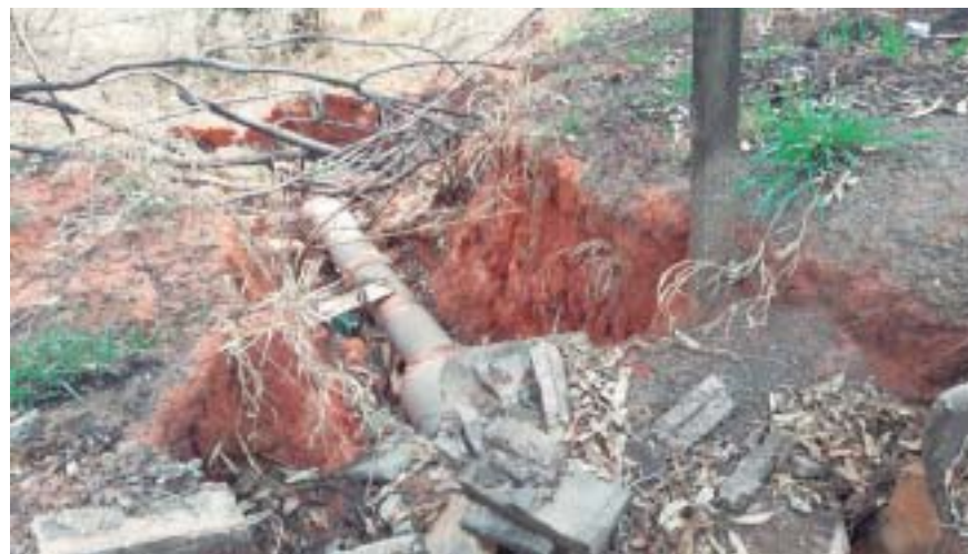
Obra vai conter assoreamento atrás dos vestiários do estádio

data em que forem iniciadas, todas as intervenções estarão concluídas em um prazo aproximado de seis meses.