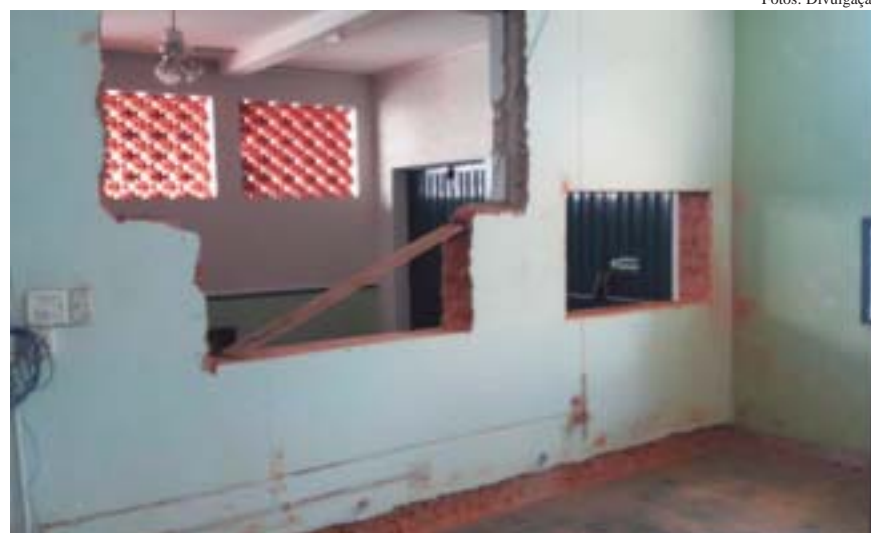
Secretaria nunca havia passado por uma reforma desse porte

Situada ao lado da quadra de tênis, a nova dependência terá 160 metros quadrados e contará com ampla área envidraçada, possibilitando uma vista panorâmica do campo de futebol. A partir da