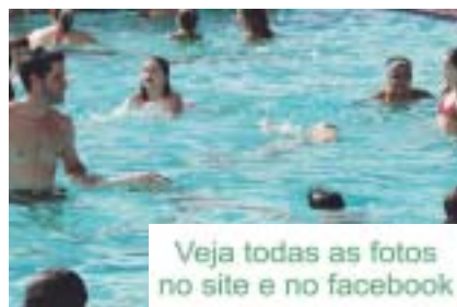
Veja todas as fotos no site e no facebook

O Cosmopolitano está participando do 15º Campeonato Regional de Malha, iniciado no dia 14 de fevereiro. As disputas envolvem nove equipes, de Cosmópolis, Indaiatuba, Campinas, Salto, Hortolândia, Santa Bárbara D'Oeste, Jundiaí, Várzea Paulista e Americana. As partidas são realizadas sempre aos domingos. Todas as equipes participantes se enfrentarão, em dois turnos, até junho.