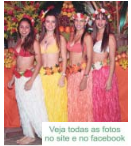
Veja todas as fotos no site e no facebook