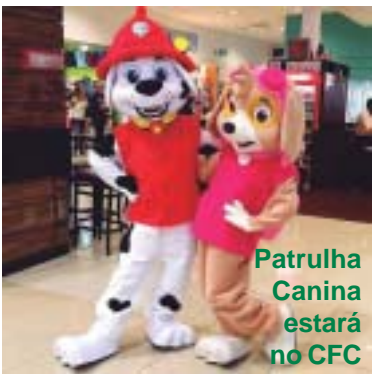
Patrulha Canina estará no CFC

Durante toda a festa, vai ter pipoca à vontade. E, às 18h, todo mundo vai ganhar sorvetes. Portanto, não vão faltar motivos para comemorar o Dia das Crianças com muita alegria no Cosmopolitano.