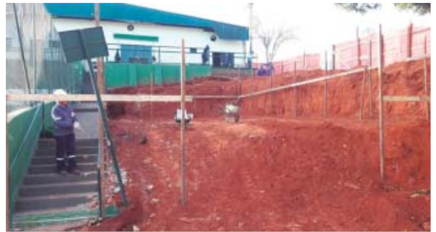
Acima e abaixo, as obras para ampliação da sala de musculação e construção de cancha de bocha e sala de jogos

A nova dependência terá um total de 160 metros quadrados e contará com ampla área envidraçada para permitir uma vista panorâmica do campo de futebol. Assim, o CFC vai ganhando novos ares, e a cada dia oferece mais conforto e segurança para seus associados e funcionários.