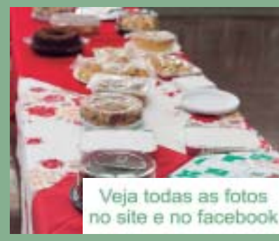
Veja todas as fotos no site e no facebook