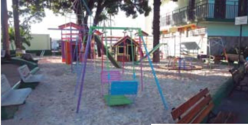
Acima, o parquinho revitalizado; abaixo, área de descanso da sauna, que ganhou novo revestimento (no detalhe ao lado)