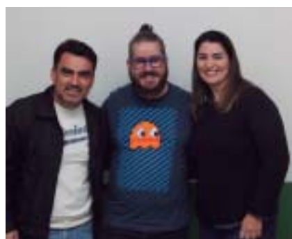
Veja todas as fotos no site e no facebook